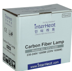
ランプ 10個 / 1箱

電気代の削減・環境に合わせられるように 100V-600Wと、200V3種類のランプ (600W/900W/1200W) を ご用意しました。