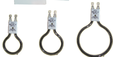
CFL600 CFL900 CFL1200